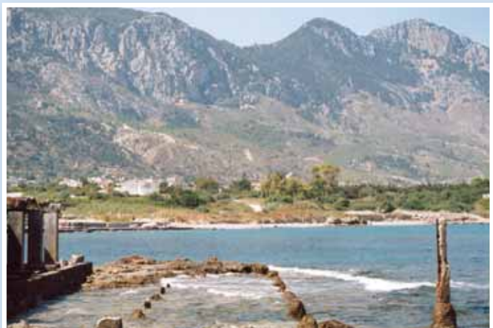
Ακτή Κανάρη στην παραλία Ασπρόβρυσης της Λαπήθου.

Λίγες μέρες μετά, το μυστικό της επίσκεψης Κανάρη στην Κύπρο μαθεύτηκε, με αποτέλεσμα να ακολουθήσει η μεγάλη σφαγή των Χριστιανών στη Λευκωσία. Ήταν η 9η Ιουλίου του 1821. Όπως είναι γνωστό, δε γλύτωσε ούτε ο Αρχιεπίσκοπος Κυπριανός, ούτε ο Επίσκοπος Κυρηναίας Λαυρέντιος, μα ούτε και οι πρόκριτοι της Λαπήθου και του Καραβά που βοήθησαν τον Κανάρη. Σχεδόν όλοι οι προύχοντες της περιοχής απαγχονίστηκαν ή σφαγιάστηκαν από τους Τούρκους στην Πλατεία Σεραγείου στη Λευκωσία, από τις 9-13 Ιουλίου του 1821, ένα τίμημα αρκετά βαρύ για τη βοήθειά τους στον Κανάρη. Ήταν ένα έγκλημα πρωτοφανούς αγριότητας για τον Ελληνισμό της Μεγαλονήσου.